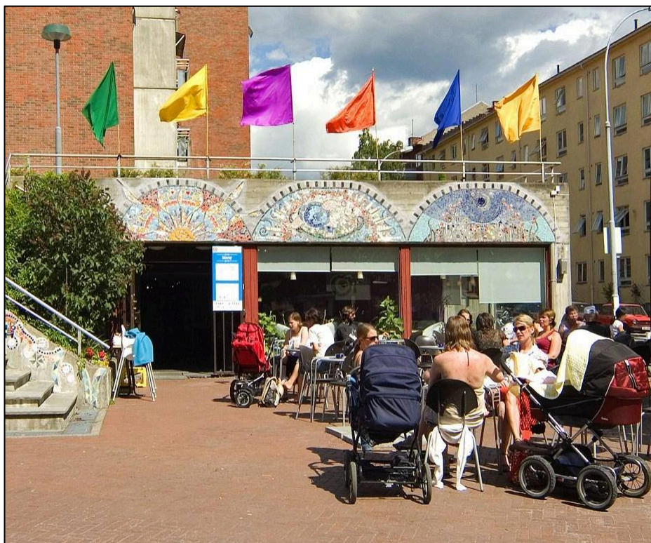
3. De beste prosjektene: Studie metodologi

Barnefattigdom: 22% av barna i bydelen regnes som fattige. Dette tilsvarer ca. 870 barn. Sammenlignet med gjennomsnittet i Oslo som er 15%.