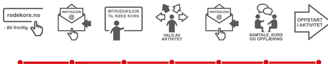
Fig. Modellen til Røde Kors på «frivilligreise».

Det er alltid behov for frivillige i Oslo Røde Kors, folk kan melde deg i over 40 ulike aktiviteter.